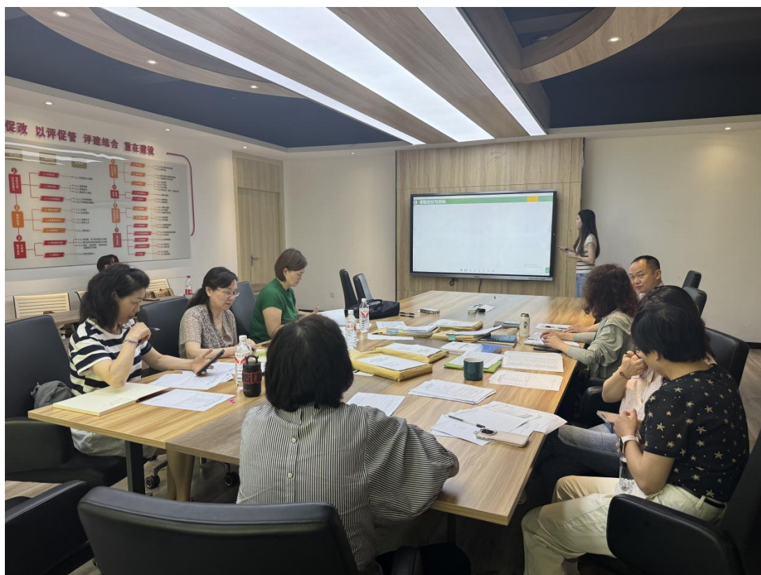
经济管理学院开新课课程评估汇报现场

来自信息科学与工程学院、机电与自动化学院、城市建设学院、经济管理学院、新闻与文法学院 18 名教师对所开新课进行了现场汇报，专业负责人到场聆听。评审组结