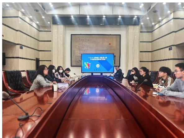
教学质量监测与评估中心开展武昌校区 教学检查培训会

本次检查开展过程中，教学质量监测与评估中心对参加检查的学生信息员进行了业务培训、现场指导以及反馈交流活动，确保检查工作顺利进行。检查结果显示，所有课堂教师到位情况、学生到课率及教室卫生情况良好，设备运行正常，信息化教学手段能充分发挥作用。