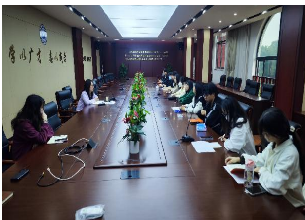
教学质量监测与评估中心开展 嘉鱼校区教学检查交流会

为更全面了解课堂教学状况，营造良好的学习氛围，切实提高课堂教学质量，学校教学质量监测与评估中心于5月8日至10日组织54名学生信息员对武昌、嘉鱼两个校区的874个课堂进行了教学检查，通过学生视角看学校教学运行状况。