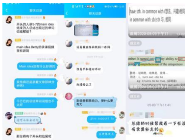
图2 丰富热烈的小组讨论