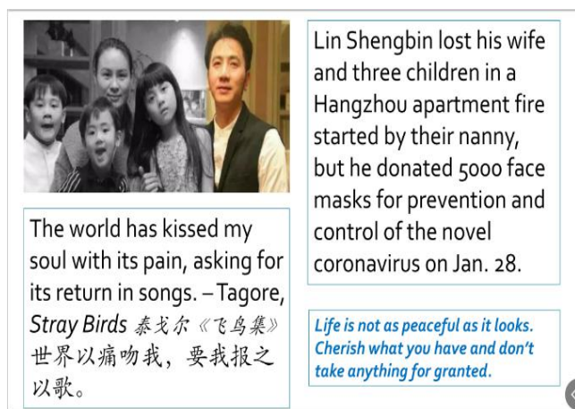
图 2 结合教材内容的案例