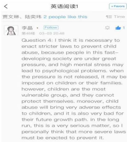
图 1 教材内容讨论

为激发学生学习兴趣，督促学生积极参与课堂，同时引导学生形成勤做笔记的学习习惯。潘琼老师每次课后通过超星学习通发起笔记拍照打卡，同学们积极踊跃的以多种方式完成课堂笔记，巩固强化了课堂教学，取得了很好的反响。